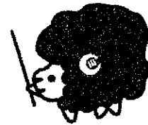
栃木県コミュニティ協会 マスコットキャラクター「コミたん」

栃木県コミュニティ協会 〒320-8501 宇都宮市塙田1-1-20 TEL: 028-623-3442 / 2110 FAX: 028-623-2121 E-mail: tochigi-community@rhythm.ocn.ne.jp