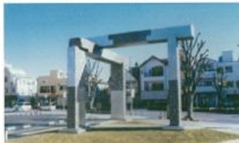
「記憶としての構造 2015」

1996年～2016年まで明大前のキッド・アイラック・アート・ホール&ギャラリーに勤務し最後のチーフディレクターを務める。舞台や美術展の裏方、ステージ照明も数多く手がける。2017年からはフリーで活動も開始。新たなプロジェクト、成城学園前に「アトリエ第Q芸術」設立/仕掛人。様々な角度から物事を見て、光をあてる仕事が出来たいと思います。今、大事な事は何か? 新たな表現の場を求めて、愛とは何かを問うています。いきさる、ほどほど。うつくしむ。好きな言葉です。