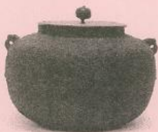
甑(こしき)口釜 (江戸中期)