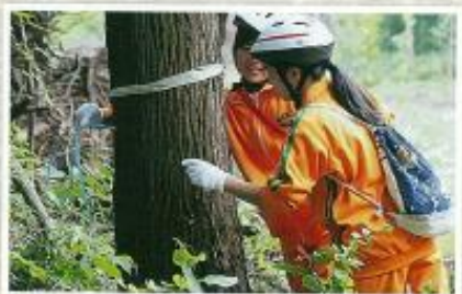
こが里山を守る会