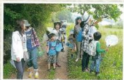
自然回復を試みる会・ピオトープ孟子