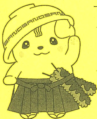
佐野ブランドキャラクターさのまる ©佐野市