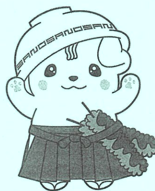
佐野ブランドキャラクターさのまる ©佐野市