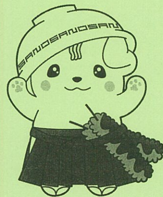
佐野ブランドキャラクターさのまる ©佐野市