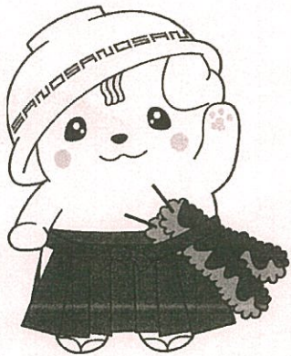
佐野ブランドキャラクターさのまる ©佐野市